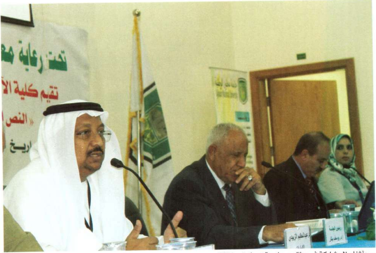
... وأثناء المشاركة في مؤتمر جامعة عجلون - 2014

● مسرحيتكم الموسومة بـ«مأساة أبي الطيب المتنبّي»، أهي محاولة منكم للمزج بين الأصالة والمعاصرة في قالب فني؟