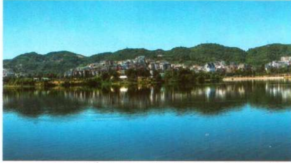
ص 36 ألبانيا... حكايات التاريخ المنسية على البحر الأدرياتيكي