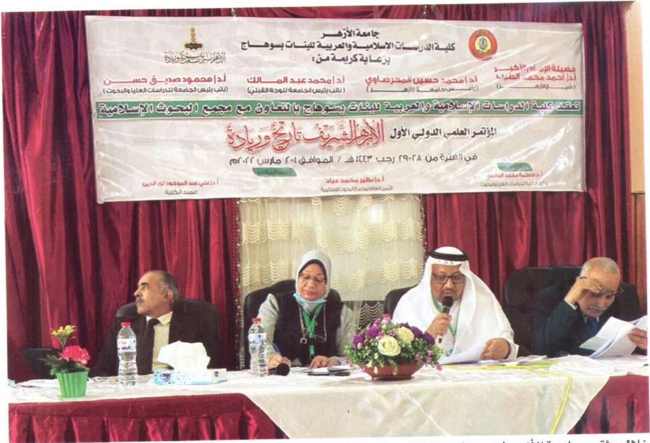
خلال مؤتمر جامعة الأزهر في سوهاج - 2022

عليه وتطلب مني تحليل المزيد من القصائد المشهورة بنفس المنهج.