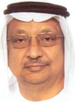
د. عبد الحكيم الزبيدي

هو شاعر وكاتب وباحث إماراتي حاصل على الماجستير في اللغة العربية وآدابها من جامعة الشارقة والدكتوراه من جامعة أبردين في بريطانيا، وله العديد من الإسهامات المهمة في الإبداع والبحث والنقد. حصل على عدة جوائز تقديرية، منها: جائزة الشيخ سلطان بن زايد لأفضل بحث عن الإمارات في أربعين عاماً في عام 2011، وجائزة الشارقة للتأليف المسرحي 2013، وله مشاركات ثقافية عدة داخل الإمارات وخارجها، وقد وردت سيرته العطرة في «دليل الأدباء» بدول مجلس التعاون لدول الخليج، و«معجم البابطين» للشعراء العرب المعاصرين، وله عدد من الإصدارات الإبداعية والنقدية، منها: اعترافات متأخرة (ديوان) عن هيئة أبوظبي للثقافة والتراث 2009، «التنصص في الشعر المعاصر في الإمارات» عن مركز سلطان بن زايد 2011، و«النكوص الإبداعي في أدب علي أحمد باكثير» عن ندوة الثقافة والعلوم بدبي 2013، و«الأهازيج الشعبية في الخليج والجزيرة العربية» وطبع بالقاهرة عام 2019، و«التنصص في الأمثال الشعبية الإماراتية» عن نادي تراث الإمارات 2022. ومع د. عبد الحكيم الزبيدي كان لنا هذا اللقاء.