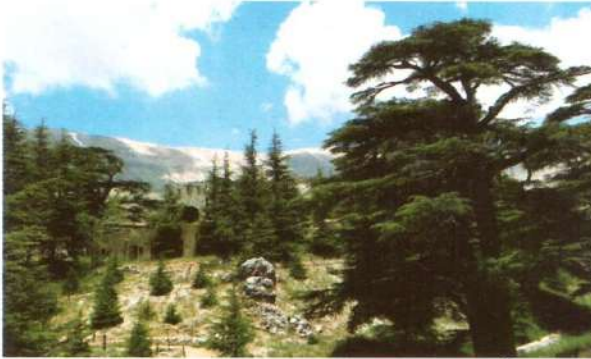
ص 106 أرز شمال لبنان في كتابات الرحالة (من القرن الـ 16 إلى الـ 19)