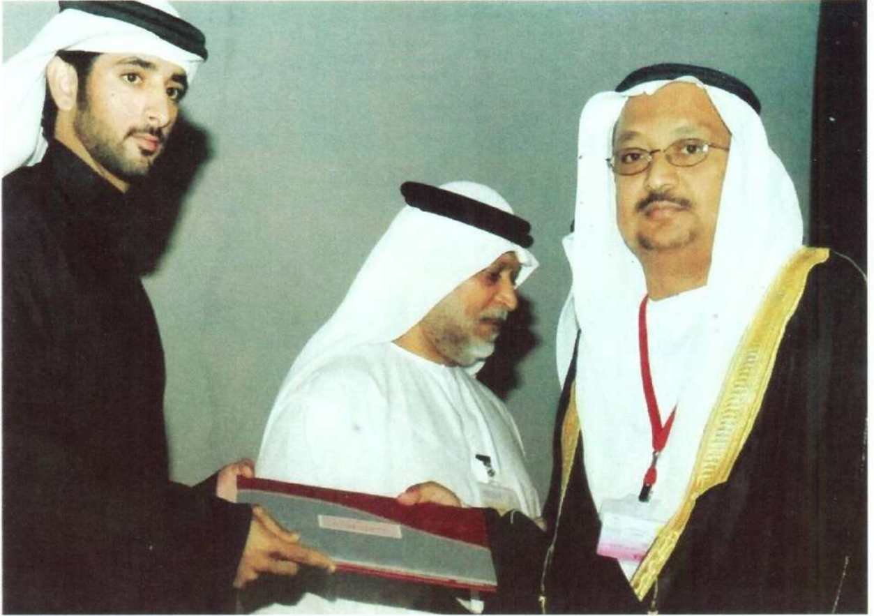
... ويتسلم جائزة راشد بن سعيد للتفوق العلمي

البكالوريوس في الإدارة الطبية، حيث مكثت هناك قرابة خمس سنوات، ولا شك أن هذه الغربية قد أثرت في كثير من نواح فهي انتقال من ثقافة إلى ثقافة مغايرة تماماً، وقد أسهمت في تغيير كثير من المفاهيم والمسلمات التي كانت عندي، وتعرّفت خلالها إلى أقوام من جنسيات متعددة مما وسع أفقي ومداركي، والحمد لله كان تأثيرها إيجابياً عليّ ولم أتأثر بالسلبيات الموجودة في مثل تلك المجتمعات. • ما الذي أردتم إيصاله إلى المتلقي عبر نصوصكم الشعرية؟