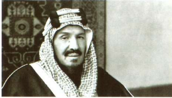
ص 96 تأسيس المملكة العربية السعودية بعيون «طوابعية»