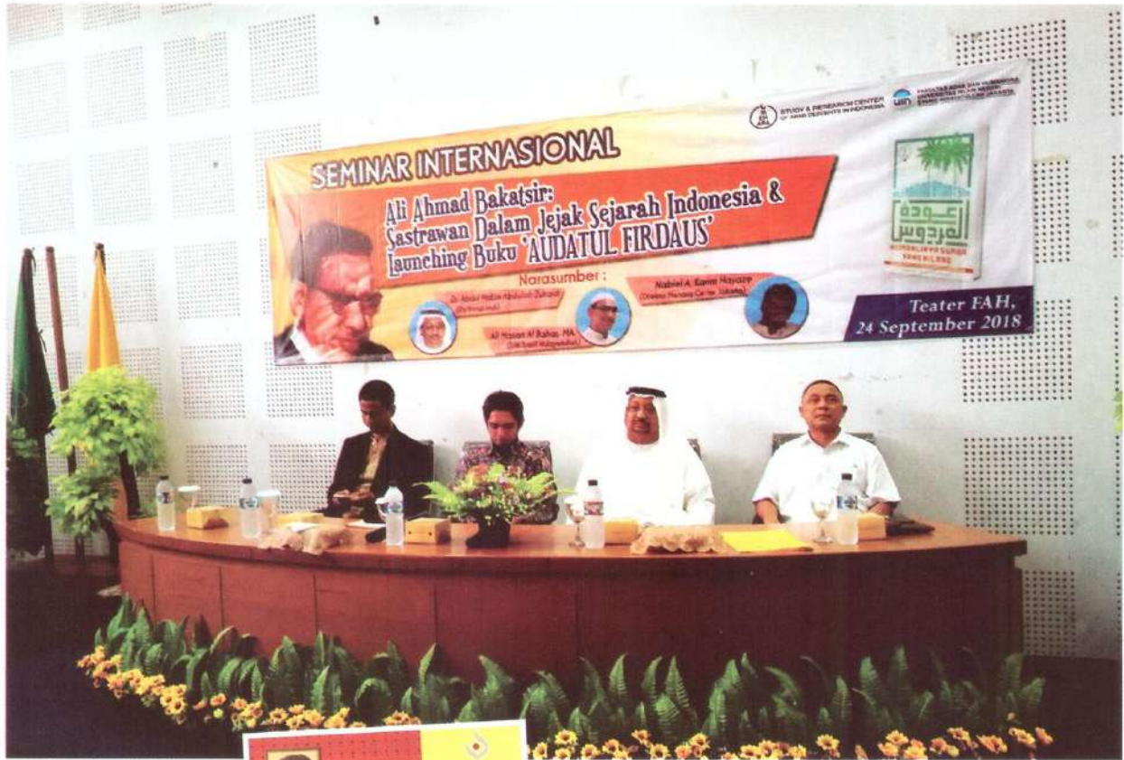
أثناء المشاركة في ندوة عن باكثير في جاكرتا - 2018